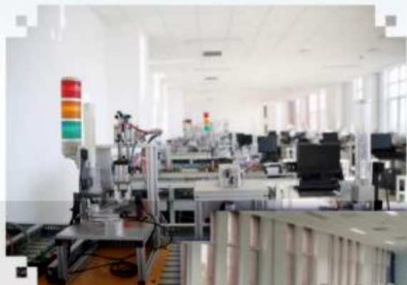
自动化生产线安装与 调试训练场所