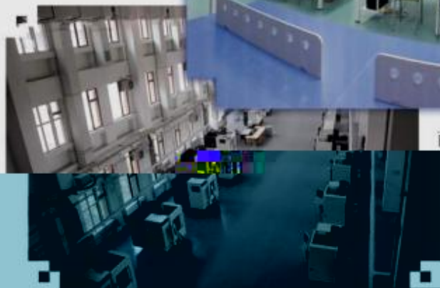
DMG 数控技术 训练场所