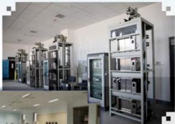
智能电梯安装调试 维护训练场所